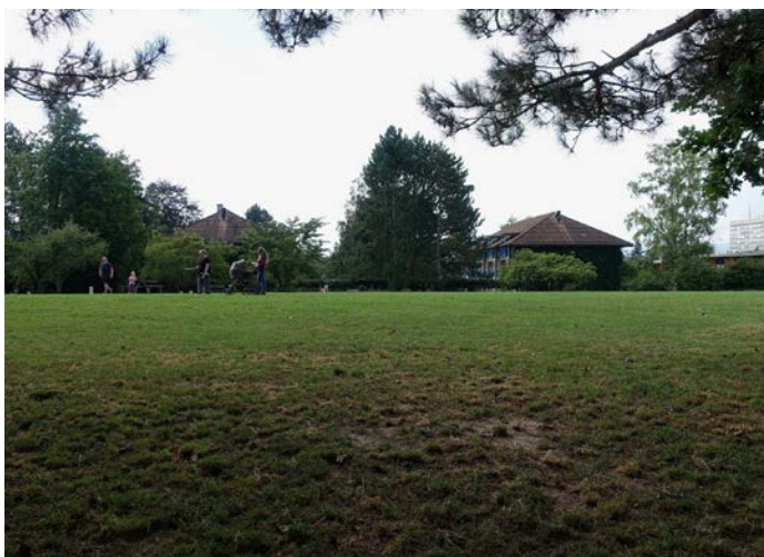
Die beiden Waldmächer decken eine Alterssiedlung der Christoph Merian Stiftung. Die Gebäude in der Buremichelsanlage werden noch in diesem Jahr abgerissen.