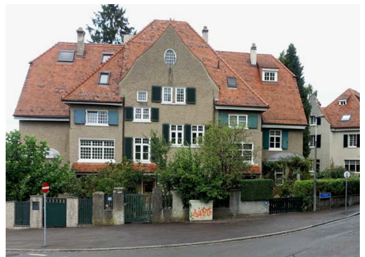
Mit dieser Villa schuf Architekt Erwin Heman 1909 einen Prototyp für eine spätere Gartenstadt. Zusammen mit dem Ingenieur Eduard Riggenschach erarbeitete er 1913 einen Bebauungsplan für das Bruderholz.