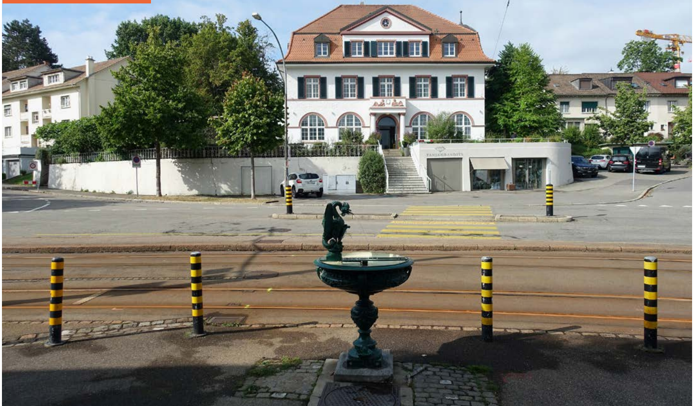
Das Quartier war als Ausflugsziel beliebt. Das einstige Restaurant Bruderholz erinnert noch an die Sommerwirtschaften. Der Basilisk-Brunnen hier im Vordergrund manifestiert die Zugehörigkeit zum Stadtkanton.