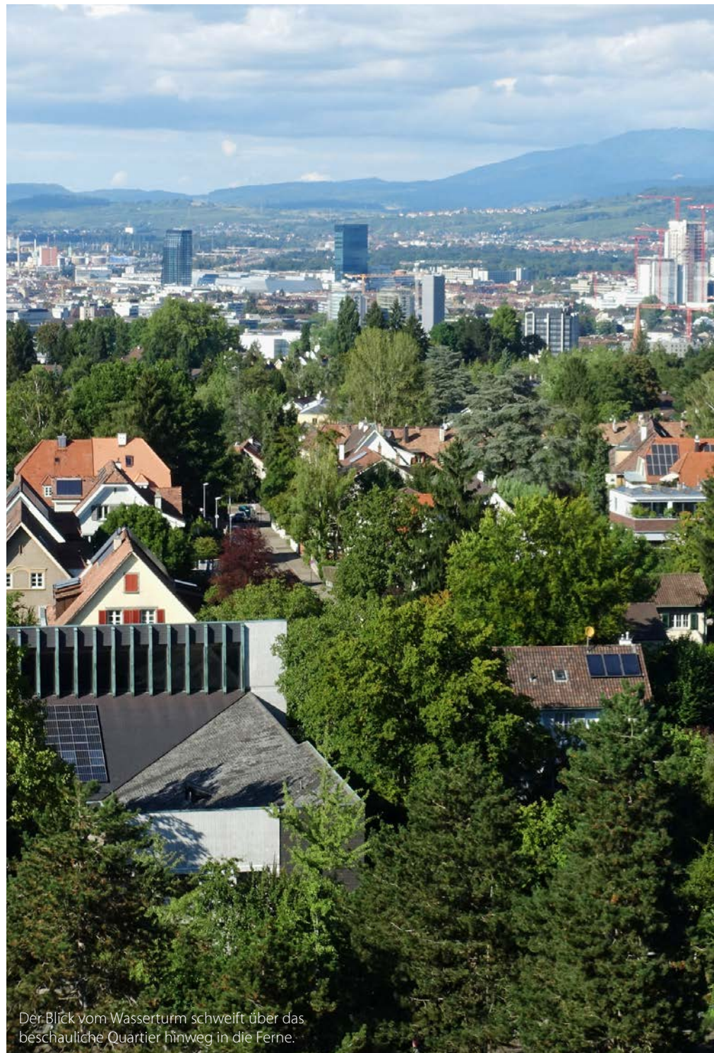
Der Blick vom Wasserturm schweift über das beschauliche Quartier hinweg in die Ferne.

Oberhalb der Wolfsschlucht und rund 50 Meter über dem Niveau des «Gundeli» beginnt jenseits des Waldstreifens die Bruderholzallee. Sie bildet das städtebauliche Rückgrat des Quartiers. Alleebäume flankieren Trottoir, Fahrbahn und Tramtrasse und führen in sanften Windungen nach Süden, Osten und hinab zum Dreispitzareal. Bei der Tramhaltestelle «Studio Basel» startete die erste Besichtigungstour.