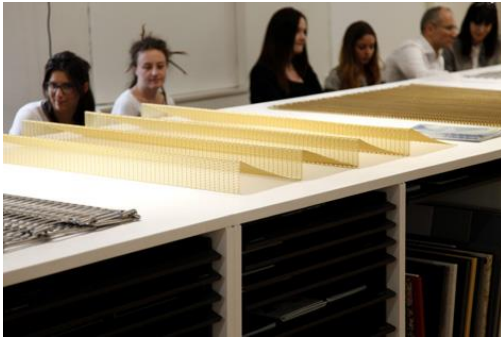
01_M_Pestalozzi_DPSBMCZ (5616x3744 Pixel)

Fotos stehen zur freien Verfügung. Sie lassen sich in hoher Auflösung herunterladen unter http://bau-auslese.ch/DPSBMCZ.zip