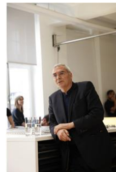
03_M_Pestalozzi_DPSBMCZ (3744x5616 Pixel)