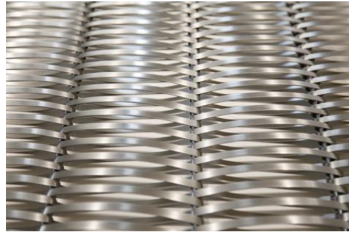
02_M_Pestalozzi_DPSBMCZ (5616x3744 Pixel)