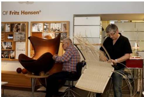
01_M_Pestalozzi_Wb (5616x3744 Pixel)

Diese Fotos stehen zur freien Verfügung. Sie lassen sich in hoher Auflösung herunterladen unter http://bau-auslese.ch/Wohnbedarf.zip