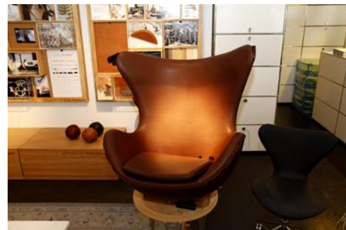
04_M_Pestalozzi_Wb (5616x3744 Pixel)