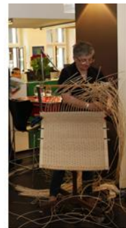
01_M_Pestalozzi_Wb (1712x3150 Pixel)