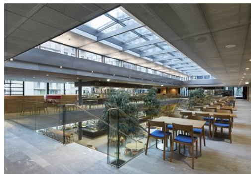
Sky Key 027 (4954x3446 Pixel)