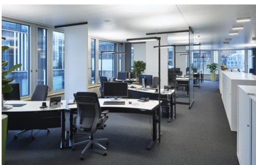
Sky Key 035 (4954x3446 Pixel)