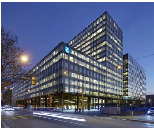
Sky Key Abend 017 (4561x3788 Pixel)

Diese Illustrationen von Steiner und Theo Hotz Partner stehen hier in hoher Auflösung zur Verfügung: http://bau-auslese.ch/Skykey.zip